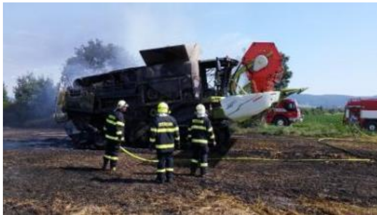
Požár zemědělského stroje