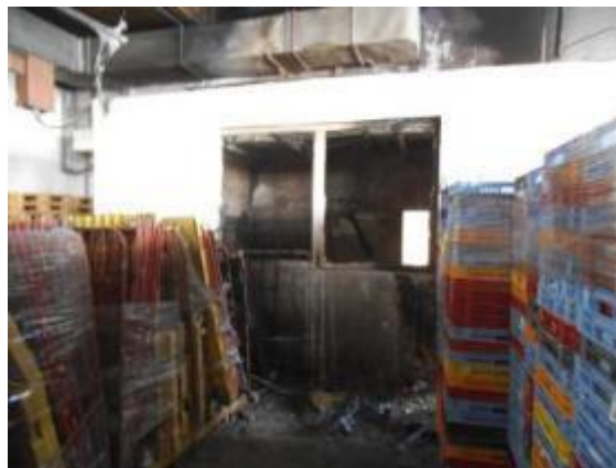
Požár skladovací haly