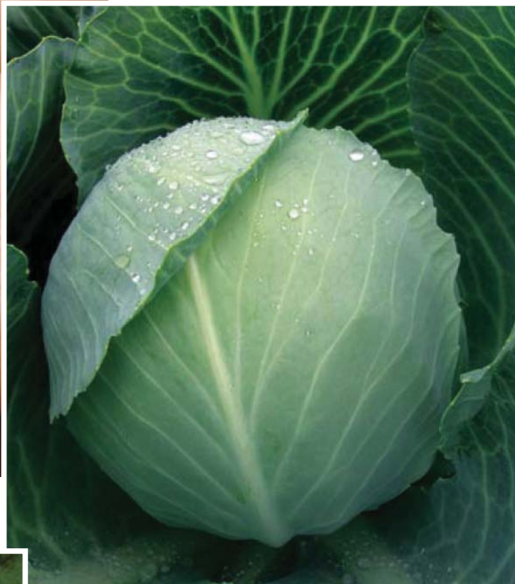
Zelí hlávkové bílé

Brassica oleracea L. convar. capitata (L.) Alef. var. alba DC.