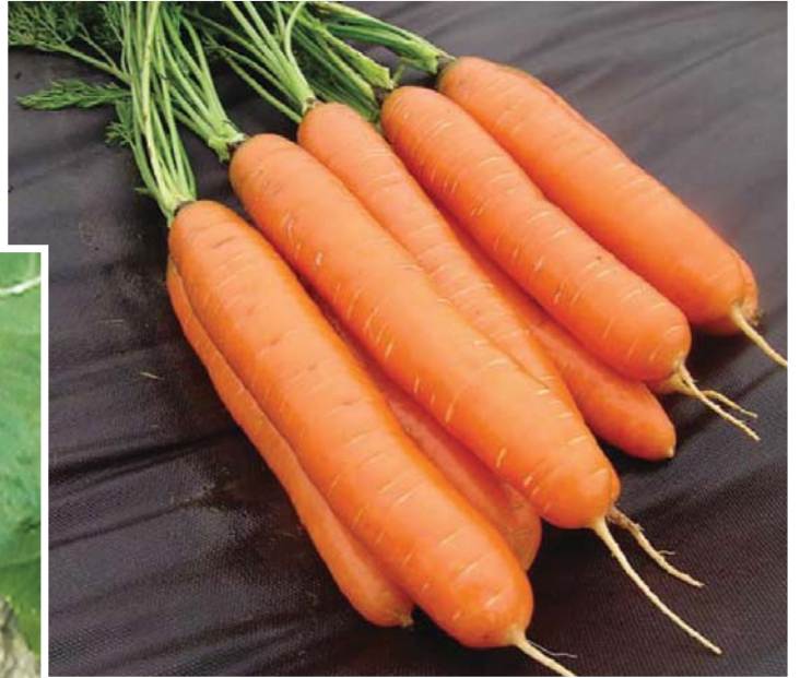
Mrkev obecná Daucus carota L.

Brassica oleracea L. convar. botrytis (L.) var. botrytis L.