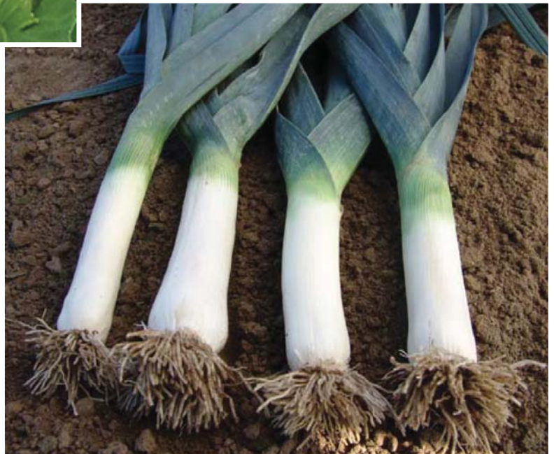
Pór pravý Allium porrum L.