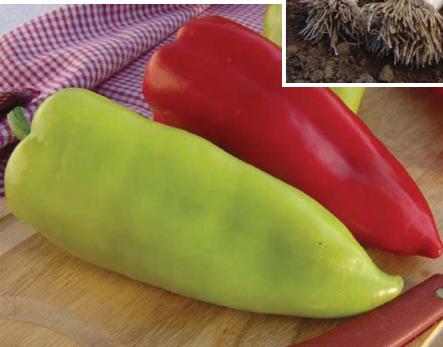
Paprika roční Capsicum annuum L. ( partim )